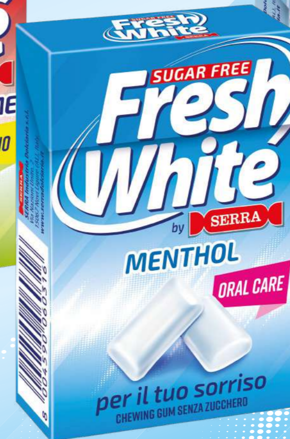
CL3024 - FRESH WHITE MENTHOL ORAL CARE 28g 8004590060316