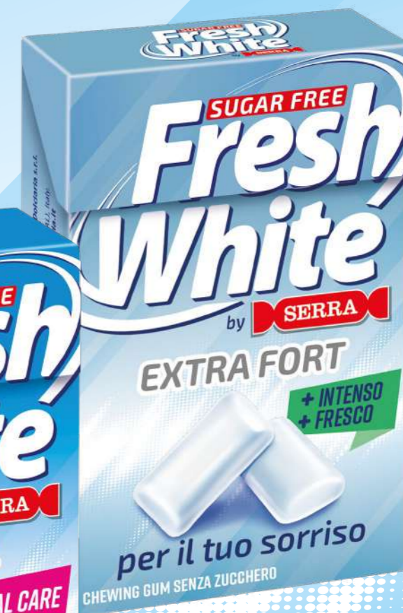
CL4324 - FRESH WHITE EXTRA FORT 28g 8004590152431