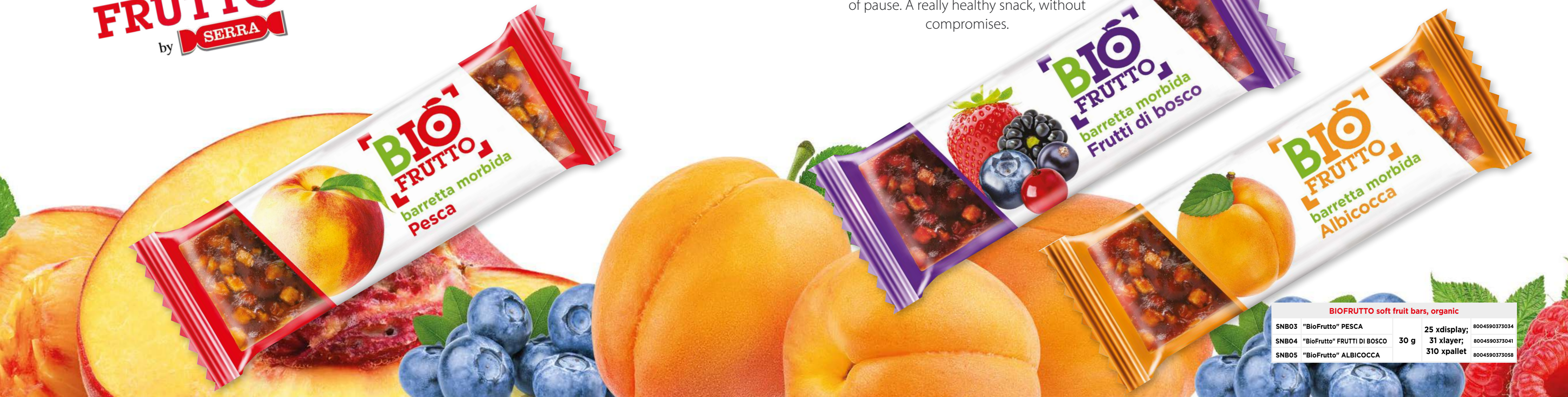
BIOFRUTTO soft fruit bars, organic