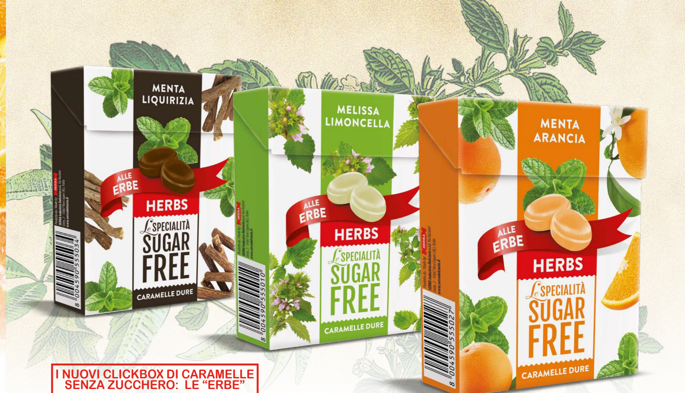
I NUOVI CLICKBOX DI CAMELLE SENZA ZUCCHERO: LE "ERBE"