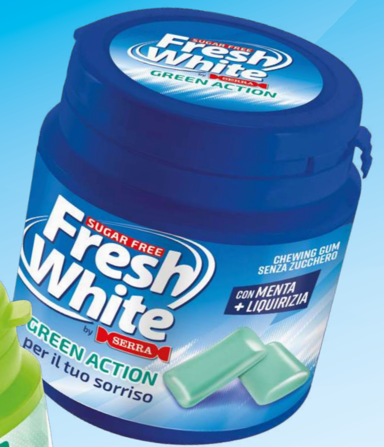
BAR3212 - FRESH WHITE GREEN ACTION 105g 8004590110332