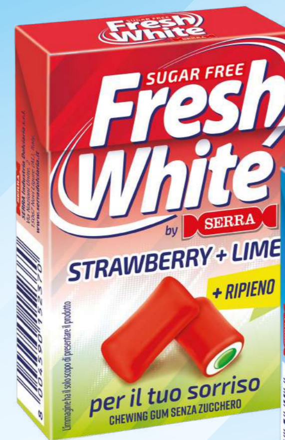
CL3824 - FRESH WHITE STRAWBERRY LIME 29g 8004590152370