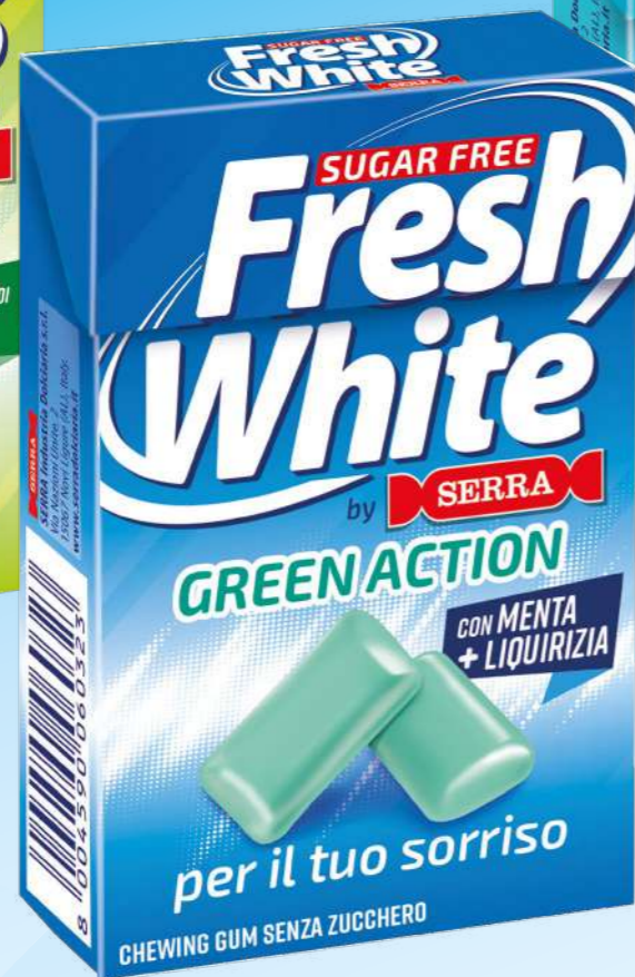
CL3224 - FRESH WHITE GREENACTION 28g 8004590060323