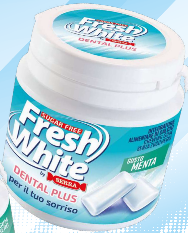
BAR5012 - FRESH WHITE DENTAL PLUS 105g 8004590211503