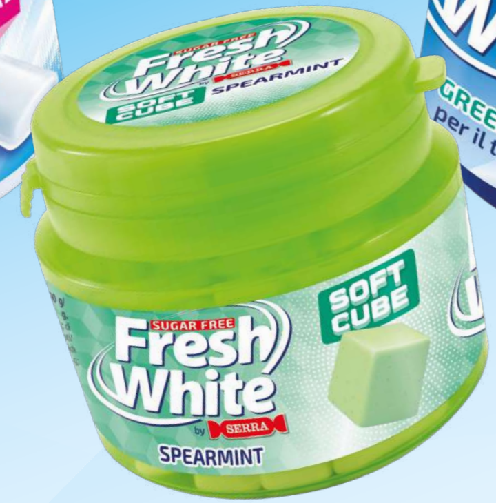
BAR0812 - FRESH WHITE SPEARMINT 77g 8004590217086