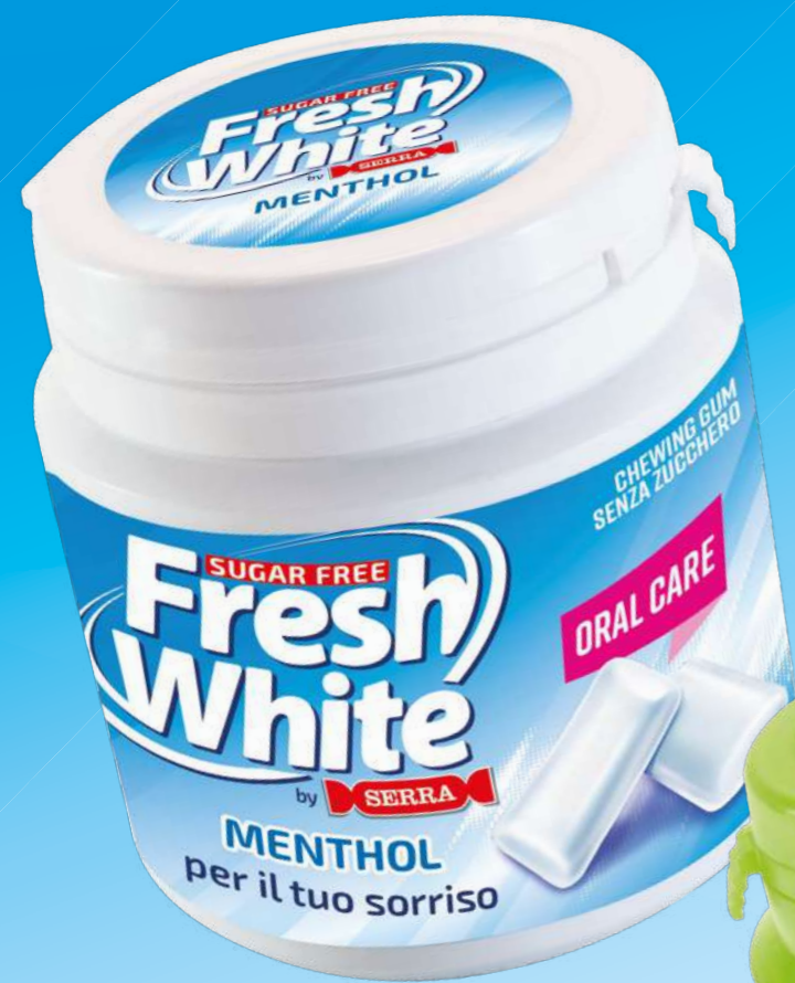
BAR3012 - FRESH WHITE MENTHOL ORAL CARE 105g 8004590110318