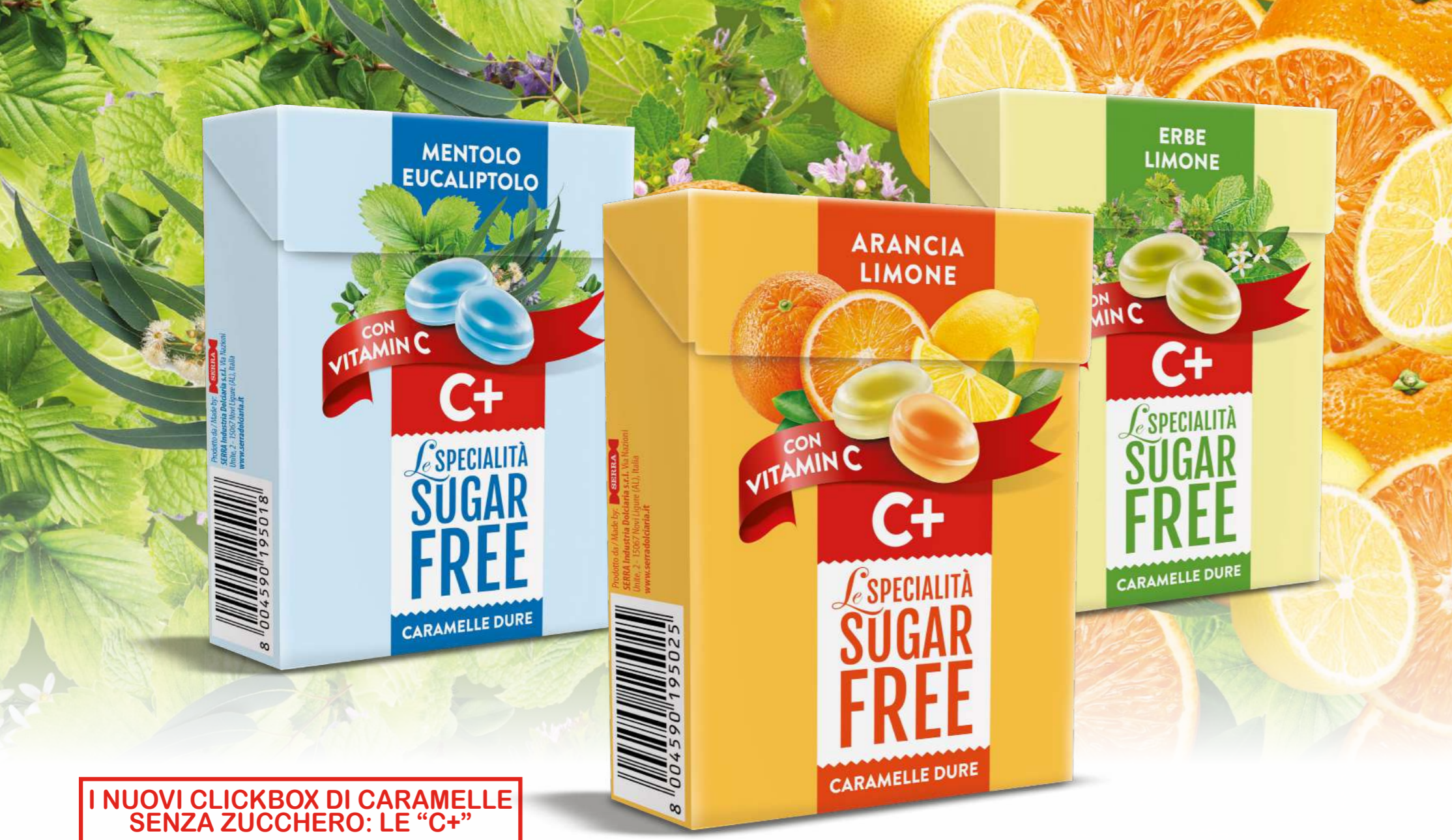
I NUOVI CLICKBOX DI CAMELLE SENZA ZUCCHERO: LE "C+"