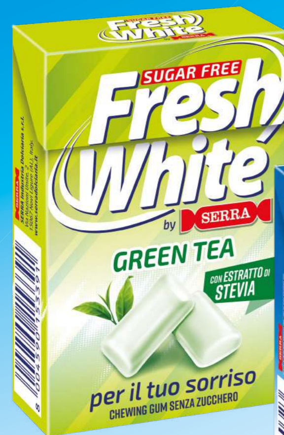
CL3924 - FRESH WHITE GREEN TEA STEVIA 28g 8004590153391