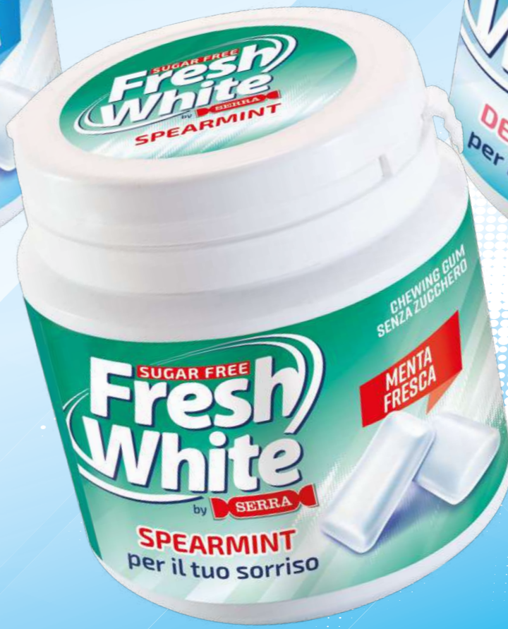
BAR4112 - FRESH WHITE SPEARMINT 90g 8004590409412