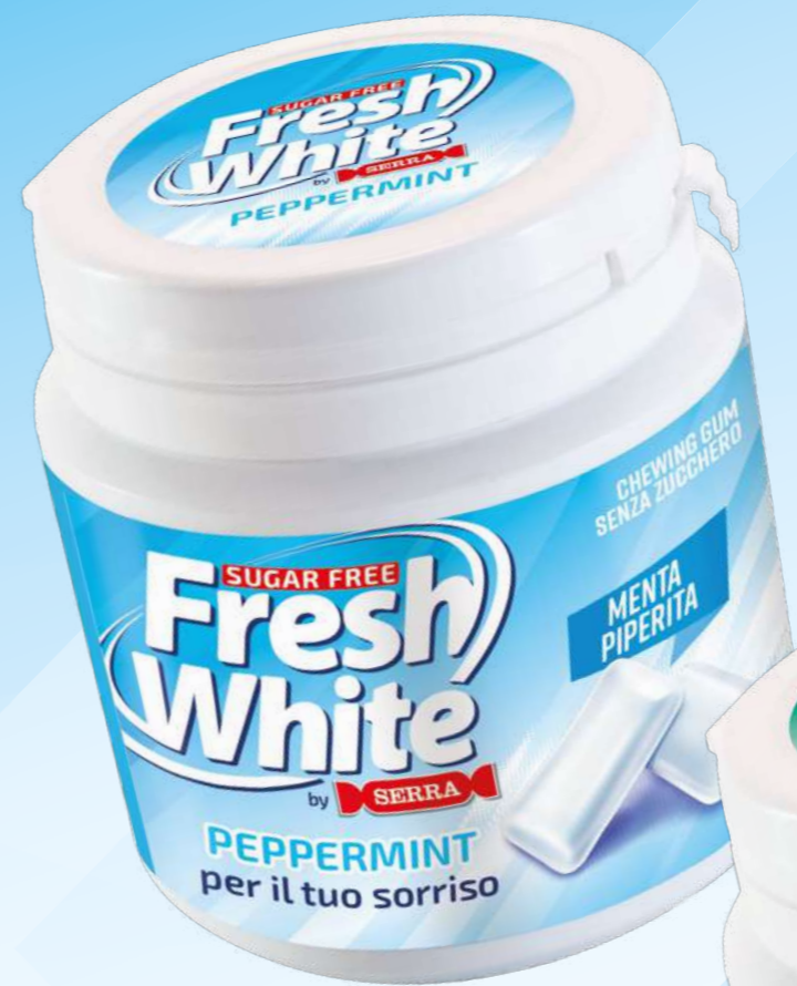
BAR4012 - FRESH WHITE PEPPERMINT 90g 8004590409405