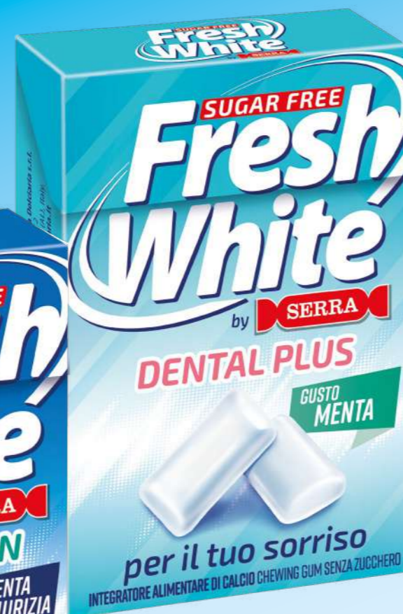
CL5024 - FRESH WHITE DENTAL PLUS 28g 8004590212500